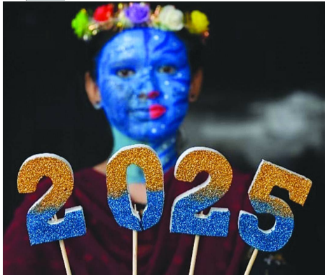
నూతన సంవత్సర వేడుకల సందర్భంగా చెన్నై శ్రీ కన్యకా పరమేశ్వరి ఆర్ట్స్ అండ్ సైన్స్ కళాశాలలో విద్యార్థినులకు శనివారం సామాజిక సందేశంతో కూడిన ఫేస్ పెయింటింగ్ పోటీలు నిర్వహించారు. -విల్లివాకం న్యూస్