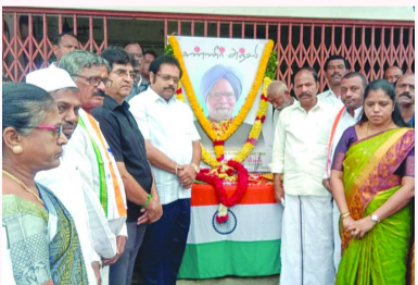
పలువురు డిఎంకె కాంగ్రెస్ పార్టీ సభ్యులు పాల్గొన్నారు